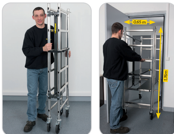
Dimensions du produit plié : 1,76 x 0,65 x 0,20 m.