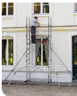
Speed'Up XL hauteur du plancher 3 m