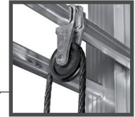
SUPPORT DE POULIE EN FONTE D'ALUMINIUM Ø 55 MM