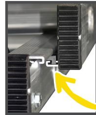
COULISSEMENT OPTIMAL par glissières intégrées aux profils des montants et dotées de guides polyamides.