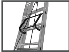
SOUTIEN DES PLANS COULISSANTS par parachute acier double bras.