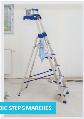
BIG STEP 5 MARCHES

STABLE grâce à ses larges patins chaussants antidérapants.