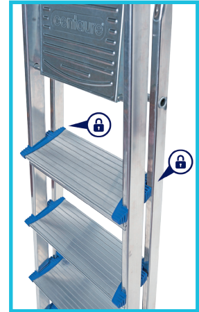
PLATE-FORME ANTIDÉRAPANTE en acier traité.

TRANSPORT ET STOCKAGE AISÉS grâce à la partie arrière de l'escabeau qui se clipse derrière les marches.